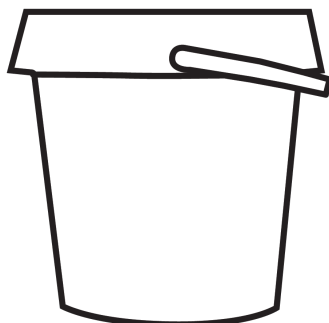
600tk ämbris (18x20cm)